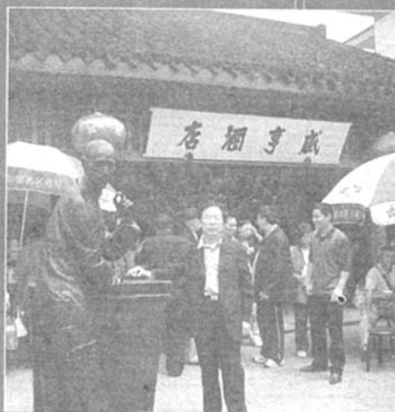
作者在鲁迅故乡留影

当缺乏，但是我总是千方百计地找书读。没有钱买日记本，我使用铅笔在普通的练习本上写日记。日记写了一本又一本，我的写作水平也不断提高。许多同学怕写作文，我却喜欢上了写作。“文学”“作家”这在有些人看来也许是十分寻常的字眼，在我看来却是那样的神圣辉煌，有着无与伦比的魅力。我很佩服作家，想不通他们怎么能写出那么多奇妙的故事来。我常常想，我一定要好好读书，初中、高中、大学一直读上去，将来也