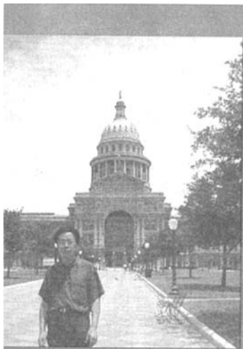
作者在美国得克萨斯州 州府前留影