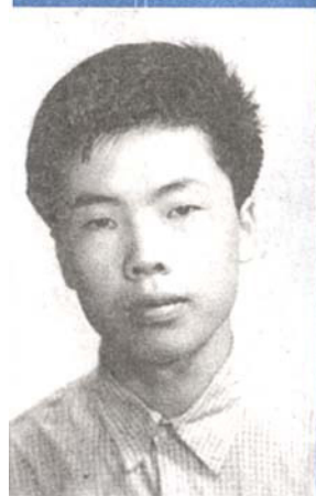
作者初中毕业时留影