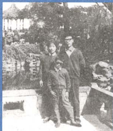
作者当农村医生时和家人留影